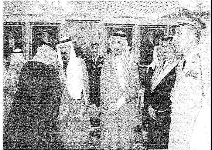
خادم الحرمين خلال مقابلة مع طيار الملك خالد متوجها الى سلطنة عمان