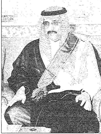
الأمير محمد متقلاً وشاح الملك عبدالعزيز -واس

حضر الاستقبال صاحب السمو الملكي الأمير منصور بن ناصر بن عبدالعزيز مستشار خادم الحرمين وصاحب السمو