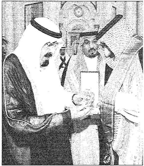
خادم الحرمين يقبل الأعيان محمد بن ثابت وشاح الملك عبدالعزيز دواس