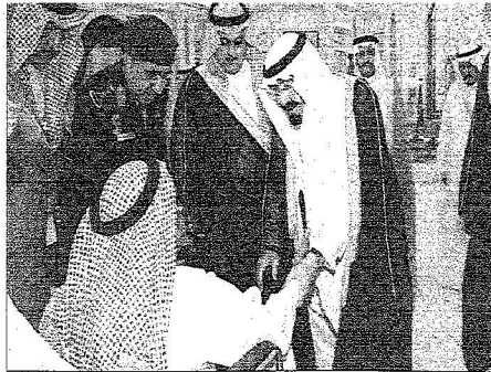
خادم الحرمين خلال استقباله للمواطنين بواحد