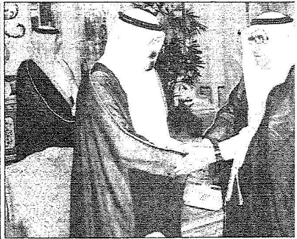
الملك عبدالله مستقبلاً للسفيرين الجعنيين دواس