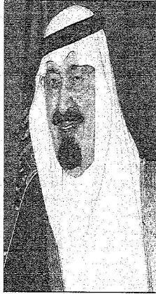
الملك عبد الله