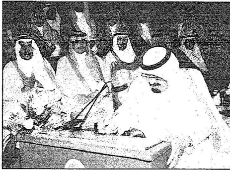
خادم الحرمين خلال حفل التفتيش