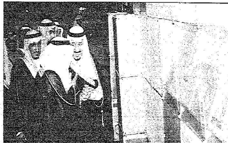
.. و يطلع على مشاركات العرض .