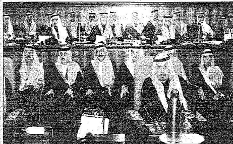
جانب من الجلسة الافتتاحية .