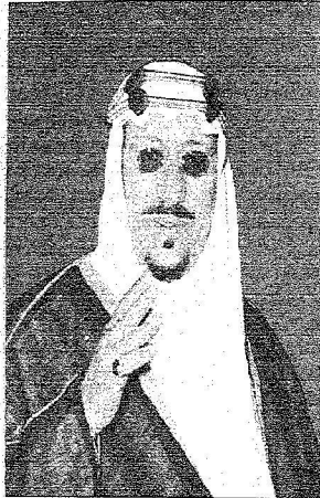
(الملك سعود بن عبد العزيز (يرحمه الله)

رعى صاحب السمو الملكي الأمير سلمان بن عبدالعزيز ✦ قائد العاصم - الرياض أمير منطقة الرياض رئيس مجلس إدارة دار الملك عبد العزيز أمس الأول حفل افتتاح الندوة العلمية عن تاريخ الملك سعود بن عبدالعزيز آل سعود (رحمه الله) التي تنظمها دار الملك عبدالعزيز وذلك بقاعة الملك فيصل للمؤتمرات بالرياض بحضور كثيف وكان في استقبال سمو أمير منطقة الرياض صاحب السمو الملكي الأمر محمد بن سعود بن عبدالعزيز أمير منطقة الباحة وصاحب السمو الملك الأمير مشعل بن سعود بن عبدالعزيز أمير منطقة نجران وأصحاب السمو الملكي الأمراء أبناء الملك سعود بن عبدالعزيز آل سعود (رحمه الله) وأمين دار الملك عبدالعزيز الدكتور فهد بن عبدالله السماري . ووصل في معية سموه صاحب السمو الملكي الأمير سعود بن فهد بن عبدالعزيز وصاحب السمو الملكي الأمير سلطان بن سلمان بن عبدالعزيز الأمين العام للهيئة العليا للسياحة وصاحب السمو الملكي الأمير الدكتور فيصل بن سلمان بن عبدالعزيز وصاحب السمو الملكي الأمير أحمد بن فهد بن سلمان بن عبدالعزيز وصاحب السمو الملك الأمير سعود بن سلمان بن عبدالعزيز وصاحب السمو الملكي الأمير نايف بن سلمان بن عبدالعزيز وصاحب السمو الملكي الأمير سلمان بن سلطان بن سلمان بن عبدالعزيز وصاحب السمو الملكي الأمير بندر بن سلمان بن عبدالعزيز .