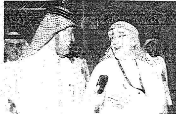
جبلان مختصاً بالرياض عن صالات الحجاج الجديدة