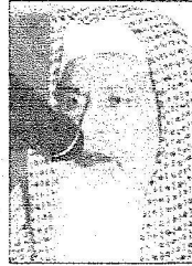
الشيخ عبدالله بن جبرين

وأضاف د المشيقح: "إن الملك عبدالله وضح في كلمته نتيجته في حكمه وسياسته ورعايته لمن تحت يده أنه جعل القرآن دستوراً والإسلام متبجاً وهذا هو الأساس العظيم الذي قامت عليه هذه الدولة المباركة من لنين الأمام محمد بن سعود ثم من تابعه بعد ذلك ثم جلالة المؤسس الملك عبد العزيز طيب الله فراه".