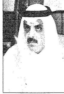
الأمير عبدالعزيز بن محمد بن غياف