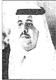
الأمير تركي بن سلمان