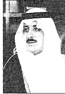
الأمير فهد بن سلطان