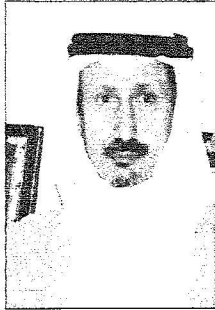
الأمير محمد بن سعود بن عبدالعزيز