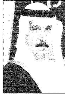
الأمير فهد بن عبدالله