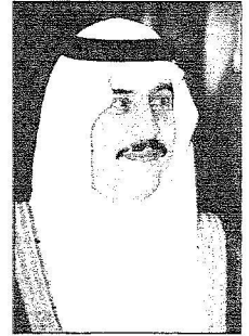
الأمير محمد بن فهد