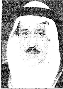
الأمير محمد بن سعود