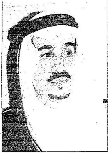
الأمير فيصل بن بندر