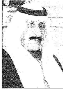
الأمير عبدالله بن عبدالعزيز بن مساعد