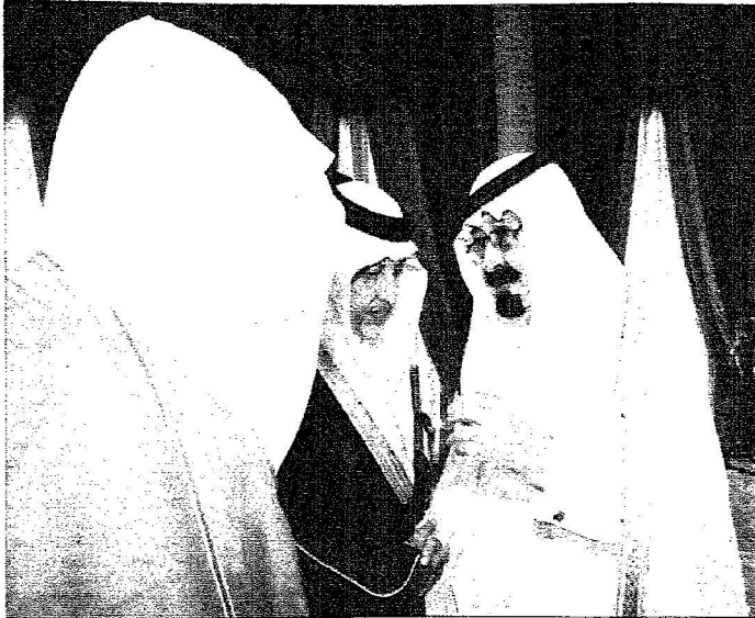
توجيه ملكي للفيصل و فيصل بن خالد بعد أداء القسم.