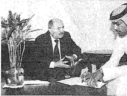
السفير البولندي خلال حديثه لـ (المدينة)

المواضيع التي ستم مناقشتها بين قيادات البلدين؟ - خلال الزيارة التي يقوم بها الملك عبدالله سيتم التوقيع على ٥ اتفاقيات، وهي اتفاقية ثنائية في مكافحة الجراثيم، والتوقيع على مذكرة تفاهم بين مدينة الملك عبدالعزيز للعلوم والتقنية والأخاديمية البولندية للعلوم، ومذكرة تفاهم بين وزارتي التعليم العالي، ومذكرة تفاهم بين وزارة الصحة السعودية ووزارة الصحة البولندية، ومذكرة تفاهم في مجال الرياضة. كما نتوقع أن يتم التوقيع على ٣ مذكرات تفاهم أخرى يقوم بها الجانب السعودي بمدينة الملك سعود بن عبدالعزيز الصحية في مدينة الملك عبدالعزيز الطبية في الحرس الوطني يرأسها ويوقع عليها الجراح العالمي الدكتور عبدالله الربيعه مع جامعة الطب بمدينة وارسوا في بولندا المركز الدولي للسمع والنطق ومركز الحالات النفسية. ❖ كيف بدأت قصة فصل التوأّم البولندي في المملكة، وماذا قالت الحكومة البولندية بهذا الخصوص؟ - بالطبع، رحب كل فرد من الشعب والحكومة البولندية بهذه المبادرة الإنسانية وعندما علمنا أن خادم الحرمين الشريفين الملك عبدالله بن عبدالعزيز أعلن عن مبادرته شعرنا بفرحة غامرة وقبلنا الخبر كخبير استثنائي، وشعرنا أن هذا الزعيم العربي الذي يتفهم للقيم الإنسانية أب لكل أفراد الشعب البولندي، وفهمنا من ذلك أن الذي بيننا أكثر من الذي يجمعنا كحضارتين وديانتين الإسلام والمسيحية، وكانت عملية فصل التوأّم البولندي بشرى للشعب البولندي. وقد أعرب الرئيس البولندي السابق عن شكره وتقديره باسم الشعب البولندي للملك عبدالله بن عبدالعزيز. ❖ ما الموقف البولندي من القضية الفلسطينية والموضوع العراقي والملف النووي الإيراني؟ - سوف يتم هذا من قبل المفاوضات الجارية، ولكن بولندا