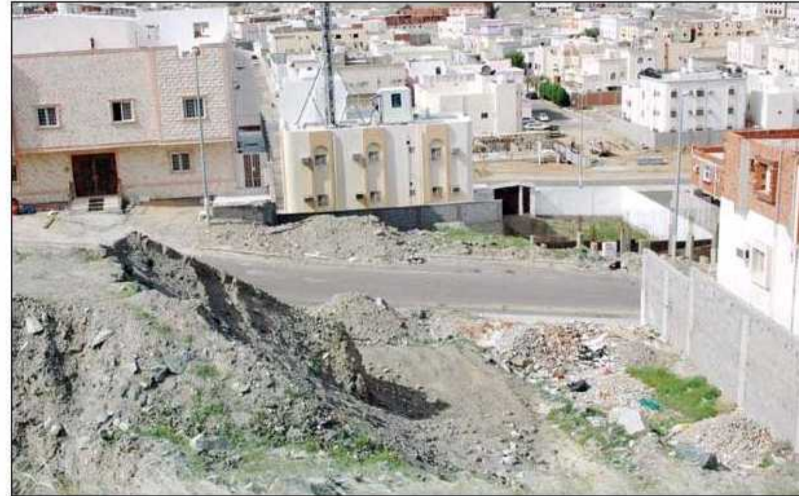
مخطط الشافعي تهدده الأخطار لوقوعه في مصب سيل وادي إبراهيم