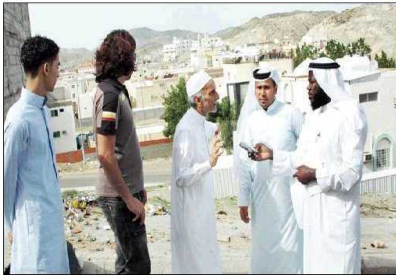
أهالي المخطط يتحدثون للمدينة

نظرًا في الحلقة الأولى من هذا الملف حول السيول في مكة المكرمة إلى الإخطار التي يمكن أن تتعرض لها مكة خلال السنوات المقبلة لا سيما فيما يتعلق بالجوانب المناخية التي تشير إلى احتمالية حدوث سيل عارم شبيه بالذي حدث في عام 1388هـ. وفي حلقة اليوم نتطرق إلى الكثير من الإخطار التي تواجه مخطط الشافعي في مكة المكرمة نظرا لوقوعه في مجرى مصب سيل وادي إبراهيم، فمع الحركة العمرانية الكبيرة التي شهدها مكة أنشأت عشرات المخططات السكنية في مجرى سيول دون أن تنتبه لذلك الجهات المعنية، إذ ركزت على الإعتمادات المالية لتطوير الحركة العمرانية دون النظر في العواقب المستقبلية التي أبرزتها سيول جدة مؤخرا.