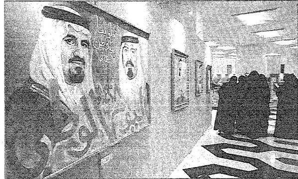
حضور نسائي لمعرض أقيم بالمناسبة في الرياض