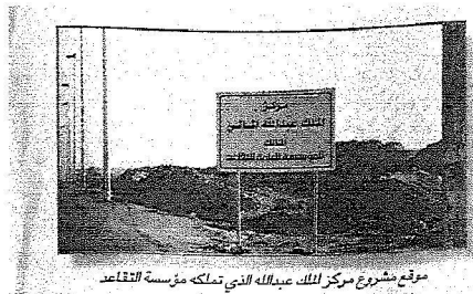
موقع مشروع مركز الملك عبدالله الذي تملكه مؤسسة التقاعد