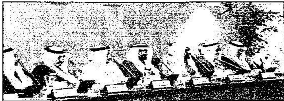
جانب من الجلسة