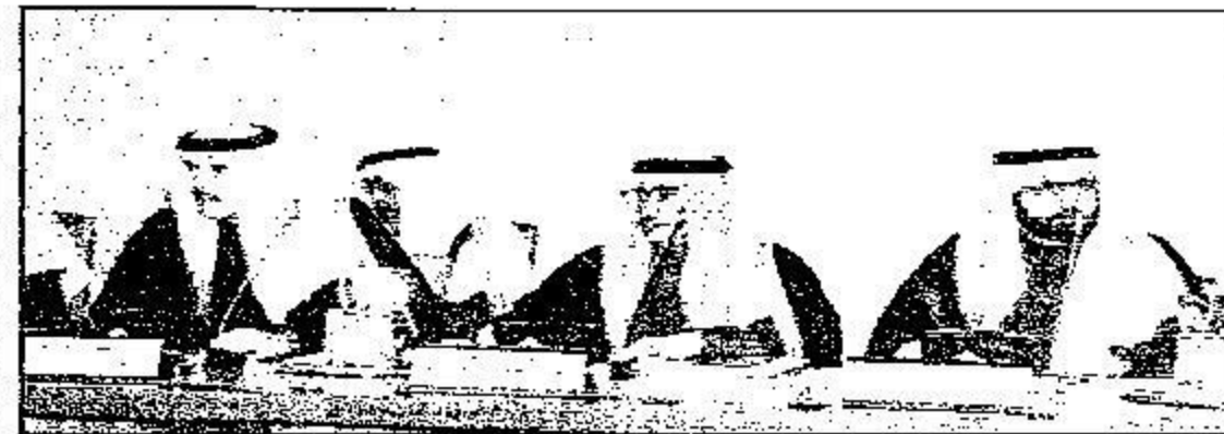
أعضاء مجلس المنطقة خلال الاجتماع