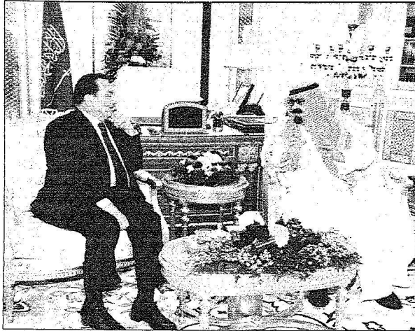
الجانبا ن يبحثان الأزمة اللبنانية