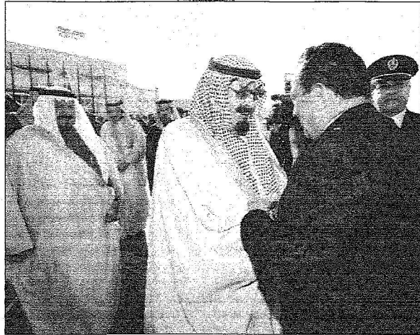
خادم الحرمين الشريفين لدى استقباله الرئيس المصري