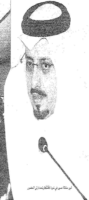
الأمير منطقة عسير في فترة العتمة يتحدث إلى الجمهور.