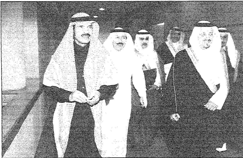
رئيس التحرير الأستاذ خالد المالك خلال استقباله سمو أمير منطقة عسير لدى وصوله إلى مقر صحيفة الجزيرة