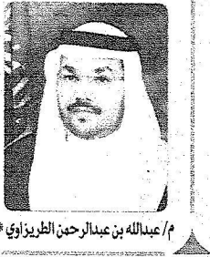
م / عبدالله بن عبد الرحمن الفيصل آل سعود

بخطط التنمية لتطوير المستوى الاجتماعي والصحي والعلمي ومواجهة التطورات والمتغيرات العالمية حتى لا تتخلف عن الركب العالمي. كما تحرص هذه الخطط على الارتقاء بقدرات المواطن وتنمية مهاراته وتدريبه وتأهيله ليشارك بمسيرة البناء والعطاء ويشرفني أن اهنئ قيادتنا الرشيدة وعلى رأسها خادم الحرمين الشريفين الملك عبدالله بن عبدالعزيز وصاحب السمو الملكي الأمير سلطان بن عبدالعزيز ولي العهد نائب رئيس مجلس الوزراء وزير الدفاع والطيران والمفتش العام - حفظهم الله - والأسرة الحاكمة وابتداء للشعب السعودي وأسأل الله عز وجل أن يحفظ بلادنا ويديم علينا نعمة الأمن والاستقرار وأن تعود لمثل هذه الذكرى ونحن نعيش في تطور ونمو في ظل قيادتنا الرشيدة - رعاهما الله - وكل ذكرى ليوم الوطن الوطن واهله بخير.