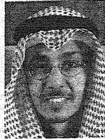
فهد عبدالعزيز المرشيد

عبدالله بن عبدالعزيز، وسمو ولي عهده الأمين صاحب السمو الملكي الأمير سلطان بن عبدالعزيز - حفظهما الله - الذي ظل يرفد القطاع السياحي من خلال ترؤسه - وفقه الله - لمجلس إدارة الهيئة العليا للسياحة، بكتيبر من