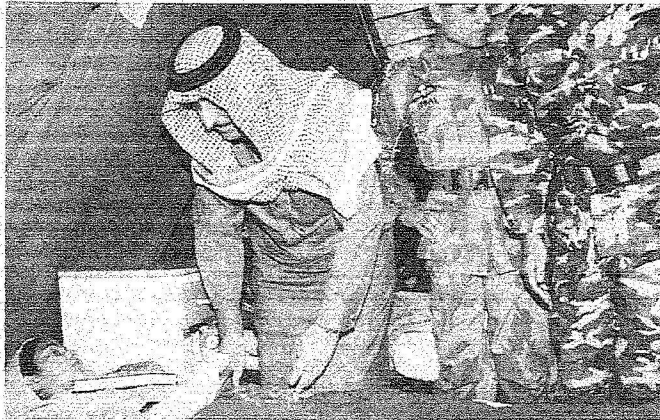
الأمير أحمد لدى زيارته المستشفى العسكري