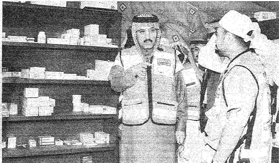
ويتفقد المستشفى السعودي الميداني

المستشفى ونقل لهم تحيات خادم الحرمين الشريفين وسمو ولي عهد وجمع أفراد الشعب السعودي، مشيداً بسموه بما يقومون به من خير لخدمة المرضى والمصابين من الإخوة الباكستانيين. وقال سموه خلال لقائه معهم: (إنكم بتملكم هذا محل رضا الخالق عن وجل بمشيئة الله ببنائكم الطبية وجهودكم المشكورة، كما أنكم محل تقدير واهتمام حكومتكم الرشيدة وجميع إخوانكم من الشعب السعودي). وأكد سموه أن الجميع معهم، وأن ما يقومون به محل تقدير واحترام الجميع، داعياً سموه إلى بذل الجهد وتأييد الواجب على أكمل وجه واحتساب هذا الأمر من الخالق عز وجل. ثم التفت الصور التذكارية مع العاملين في المستشفى، كما شرف سمو نائب وزير الداخلية حنظل الغداه الذي أقيم بهذه المناسبة.