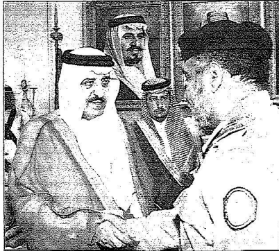
الأمير أحمد يصافح أحد الضباط