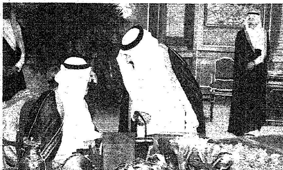
خادم الحرمين خلال ترؤسه جلسة مجلس الوزراء

حوبة ونشراً قرر مجلس الوزراء الموافقة على عدد من الإجراءات من أهمها: أولاً: قيام جميع الأجهزة الحكومية بالتنسيق والتعاون الكاملين مع وزارة الصيغة المرفقة بالقرار والتوقيع عليها ومن ثم دفع ما يتم التوصل إليه لاستكمال الإجراءات النظامية اللازمة. ثانياً: قيام الجهات المختصة ببذل مزيد من الجهود لتحسين الشفافية في إعداد البيانات. ثالثاً: قيام الجهات المختصة بتعميق السوق الثانوية للأوراق المالية وإنشاء سوق ثانوية للسندات الحكومية. رابعاً: الإسراع في وضع نظام للرن العقاري ورفع نسبة استكمال الإجراءات النظامية.