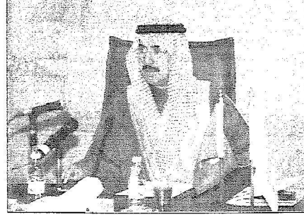
د. الدارwish خلال تمشين الموقع