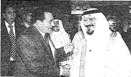
الأمير سلطان يودع فخامته لدى مغادرته مطار الملك عبد العزيز

جمهورية مصر العربية في المملكة. وكان قد وصل فخامة الرئيس محمد حسني مبارك رئيس جمهورية مصر العربية الشقيقة إلى جدة أمس الأول في زيارة للمملكة. وكان في استقبال فخامته بمطار الملك عبدالعزيز الدولي أخوه خادم الحرمين الشريفين الملك عبدالله بن عبدالعزيز آل سعود عند