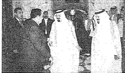
خادم الحرمين يودع الرئيس مبارك

جمهورية مصر العربية في المملكة. وكان قد وصل فخامة الرئيس محمد حسني مبارك رئيس جمهورية مصر العربية الشقيقة إلى جدة أمس الأول في زيارة للمملكة. وكان في استقبال فخامته بمطار الملك عبدالعزيز الدولي أخوه خادم الحرمين الشريفين الملك عبدالله بن عبدالعزيز آل سعود عند