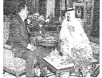
خادم الحرمين لدى اجتماعه بالرئيس مبارك