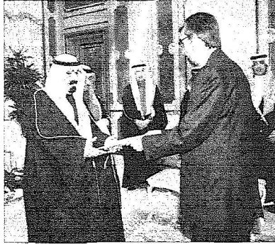
الميك خلال تسلمه اوراق اعتماد عدد من السفراء المعيّنين بالمملكة

وأشار السفير إلى أن الجميع يتطلعون إلى توجيهات خادم الحرمين الشريفين ونصائحه الحكيمه داعياً الله أن يجعل هذا البلد آمناً وأن يرزق أهله من الثمرات ويحفظ خادم الحرمين الشريفين وسمو ولي عهده الأمين والحكومة الرشيدة وأن يفسد خطاهم لما فيه خير لهذه البلاد وللأمة وللإنسانية. حضر تقديم أوراق الاعتماد صاحب السمو الملكي الأمير عبدالله بن عبدالعزيز مستشار خادم الحرمين الشريفين