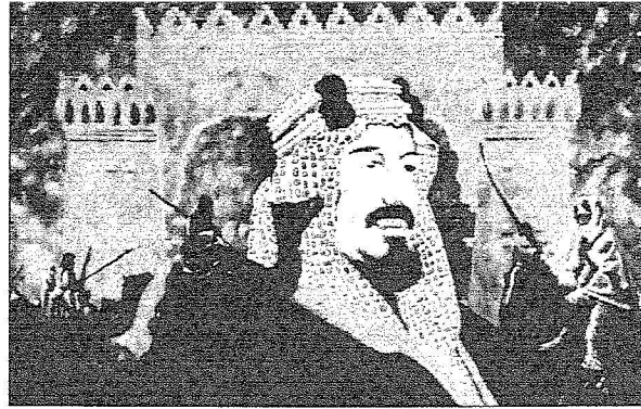
لوحة للفنانة شريفة السديري