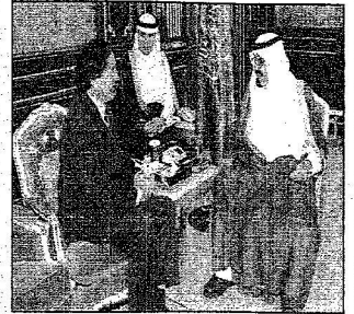
ولي العهد يستقبل سفير روسيا