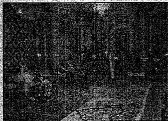
استقبال علم الحرمين لشهادات التعليم والدراسات والبحوث بكافة تخصصاته ببولندا للسودان