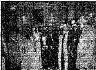
علم الحرمين مستقبلاً أمتنا في المنتدى التحضيري للغة الانجليزية