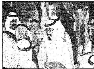
علم الحرمين خلال تلقيه البيعة من المواطنين بقصر الحكم