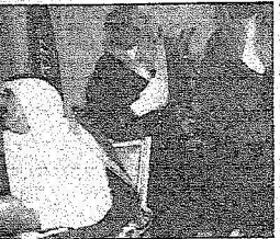
وقد التقتنا من جميع المناطق تواخيت لتكديم العيمة والمجنيد الأولئك وقد أهدى الجهد