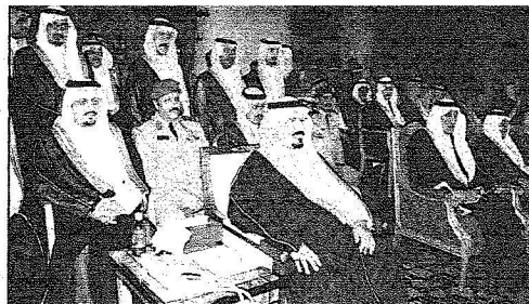
الأمير سلطان لدى تشريفه حفل إمارة منطقة عسير