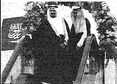
الأمير سلطان لدى وصوله مطار أبها