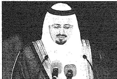
الأمير فيصل بن خالد يلقي كلمته في حفل إمارة عسير

أبها - يحيى الشبرقي، سعد آل حسين، إبراهيم العامر، وأس: