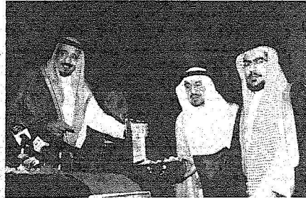
الأمير سلمان يسلم محمد الجميع ميه

غادر سموه مكان الحفل مودعاً بمقتل ما استقبل له من حفاوة وتكريم. هذا وقد حضر الحفل صاحب السمو الملكي الأمير سعود بن فهد بن عبدالعزيز، وصاحب السمو الملكي الأمير محمد بن سلمان بن عبدالعزيز، وصاحب السمو الملكي الأمير