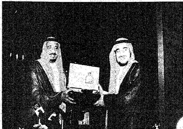
الأمير سعود بن فهد بن عبد العزيز يتسلم دواً من الأمير سلمان □ تصوير: فحي كالي - التهامي عبد الرحيم