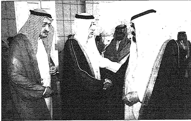
خادم الحرمين لدى استقباله أبناء الفقيد الأمير عبدالله الفيصل