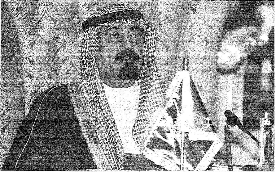
خادم الحرمين الشريفين الملك عبدالله بن عبدالعزيز

■ سرعة تنفيذ البرامج والمشاريع المشتركة الخاصة بالتعليم العالي