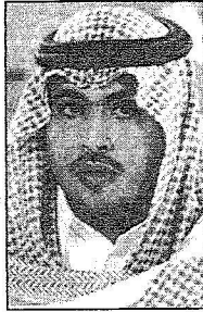
الامير محمد بن فيصل