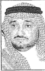
الامير خالد بن طلال