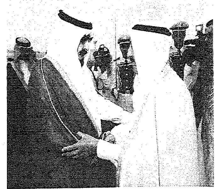
الملك عبدالله يرحب بأخيه أمير الكويت