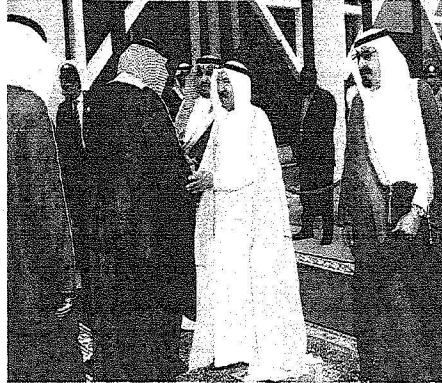
الصباح يصافح مستقبليه في مطار القاعدة الجوية