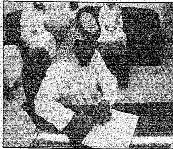
أحد المستفيدين يوقع على استلام مسكنه