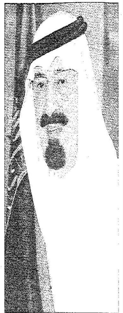
خادم الحرمين الشريفين