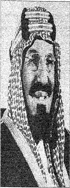
الملك عبد العزيز - طيب الله ثراه

المتسابقون يلتقون بعملاء المملكة وبرامج تفاعلي مكث يصاحب فعاليات المسابقة