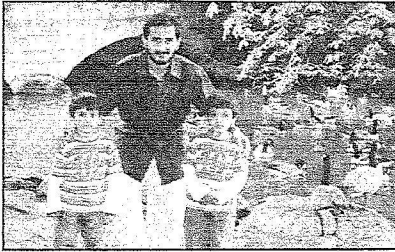
مساعد الحميص وأطفاله يتشرون استمرار صرف مكافأة لراةقين

المتعثرين في المملكة المتحدة وإيرلندا؛ الأمر الصافي وأنضم ولم يستثن المرافقين. وأوضاعنا الحالية صعبة، وإذاعات سيوة أحد إيقاف المكافأة العوھلي؛ سأعطي مكافأتي لأحد الأشخاص وبعدها يقرر هل سيأكل في ستر بوكس أم يعمل فيه؟