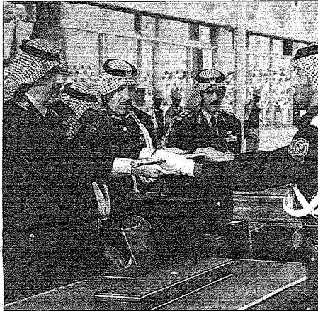
الأمير متعب بن عبدالله في إحدى مناسبات الحرس الوطني