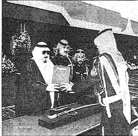
الأمير بدر بن عبدالعزيز يرمي حفل تخرج