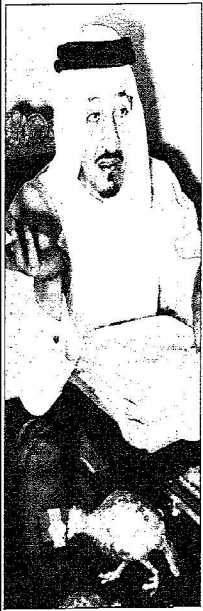
وفي مكتبه بوزارة الداخلية