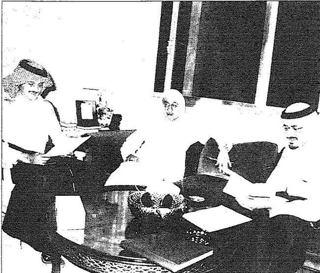
وفي اجتماع لمجلس أمناء مؤسسة الملك فيصل الخيرية ويظهر في الصورة الأمير خالد والأمير تركي الفيصل