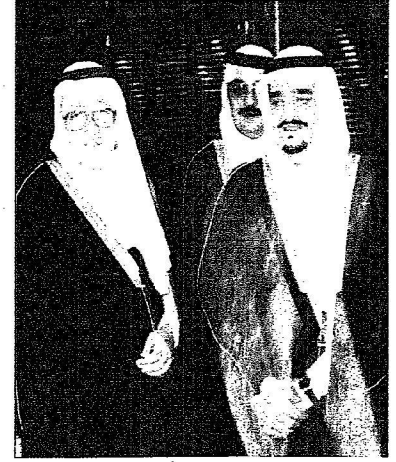
الأمير محمد بن فيصل والملك فهد رحمهم الله