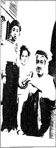
ويعلمه محمد ومجاهد