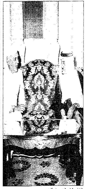
الداخل مع الرئيس الجديد جواد آل نهي