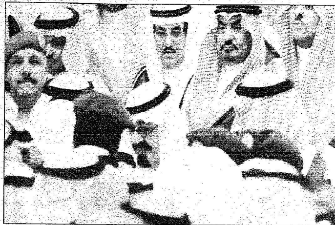
اشك عبدالله يتكلم سديته ملكا للبلاد من ونجد الوالدين في قصر الحكم