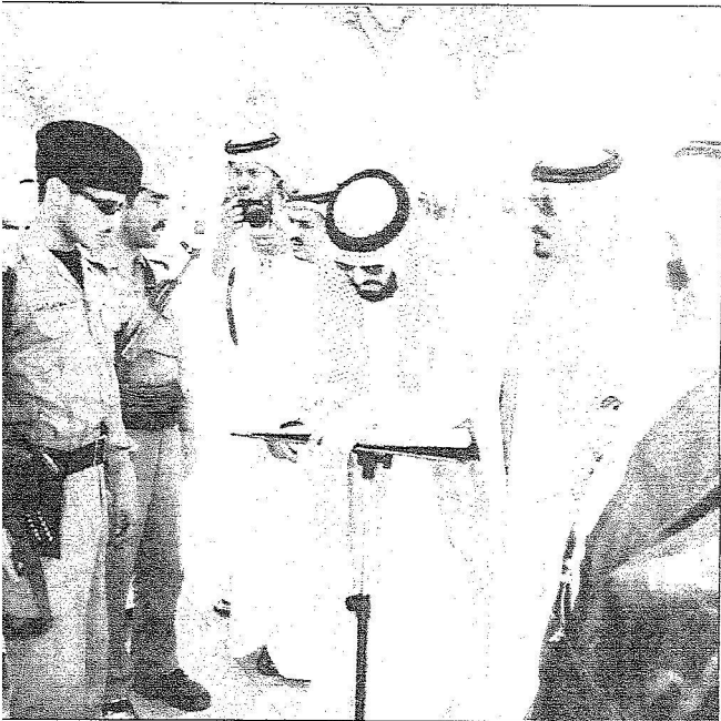
أحد المواطنين يسجل اسمه في سجل الزائرين بقصر الحكم مع بدء تحمل النيابة للملك