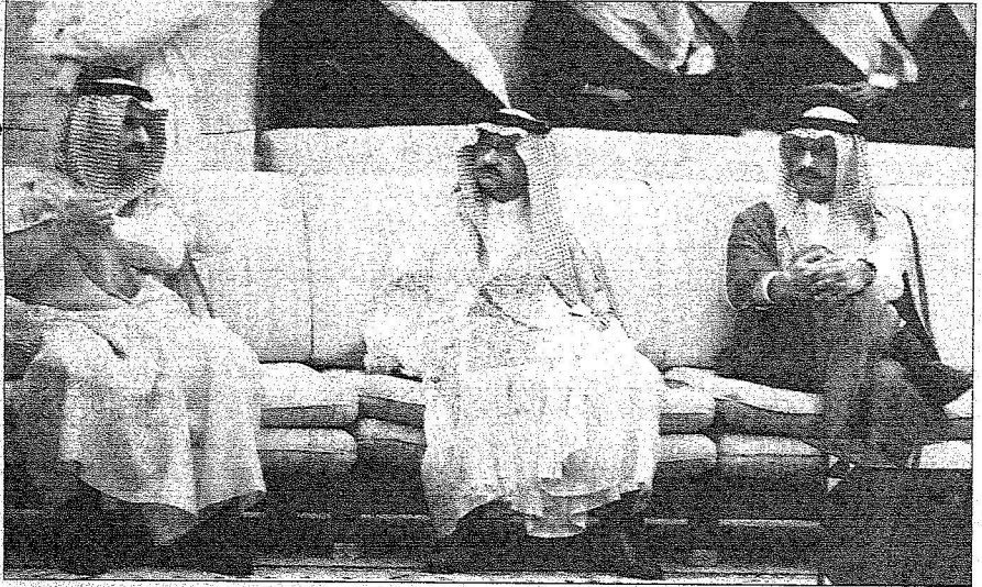
عدد من الأمراء أثناء حضورهم مراسم التولية في قصر الحكم