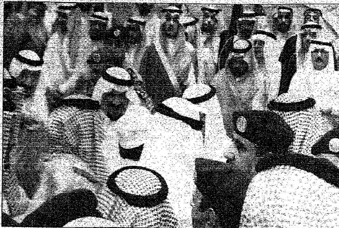
ولي العهد يتقبل السليحة من المواطنين المس