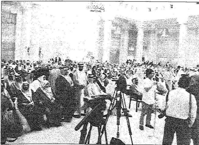
وكالات الأنباء العالمية سجلت حجم الإنفال الكبير الذي شهده قصر الحكم للمبايعة أمس