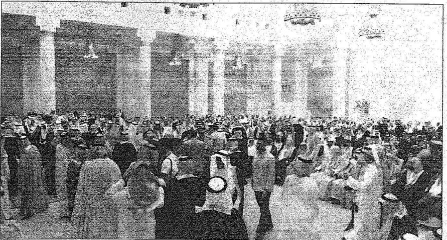
امتدت طوابير المبايعين الذين احتشدوا داخل قصر الحكم