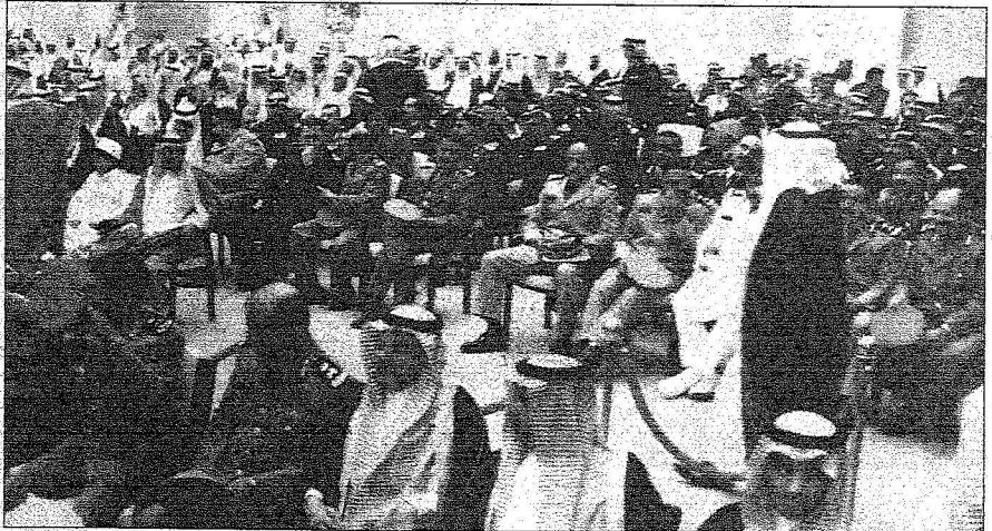
قادة القطاعات العسكرية قدموا لتقديم البيعة