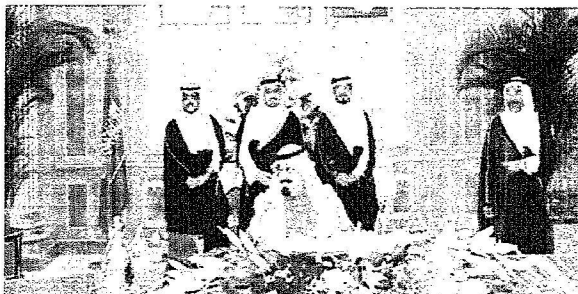
خدم الحرمين مترشاً مجلس الوزراء ظهر أمس