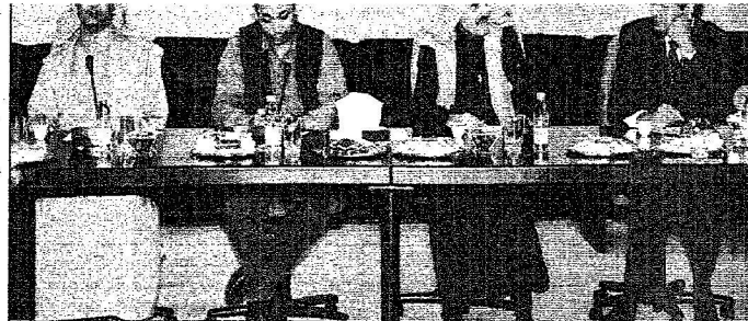
رئيس التحرير خلال لقاء الوفد الإعلامي الهندي