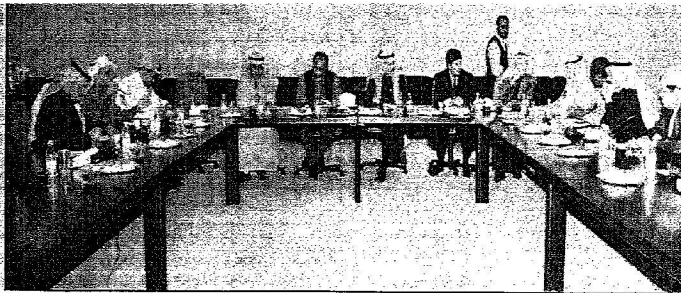
جلب من حوار الوفد الهندي مع الرياض.

المصدر : الرياض التاريخ : 21-01-2006 العدد : 13725 الصفحات : 7 المسلسل : 26