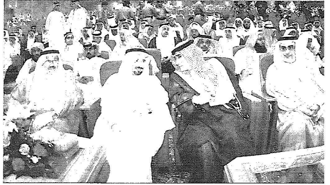
مسؤولو ووجهاء واعيان منطقة مكة خلال اللقاء