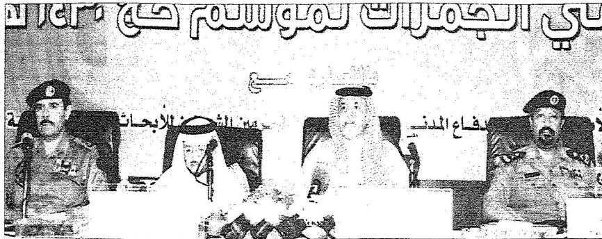
وزير الحج خلال زيارته ورشة تنظيم وإدارة رمي الجمرات أمس

مدينة متكاملة المرافق والخدمات لـ ٣٠٠ ألف حاج في الساعة