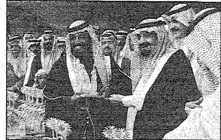
الأمير مشعل يسلم لجنة الفائزين جائزته

دعا إلى نبذ الفتن والتعصب وإثارة النعرات ..