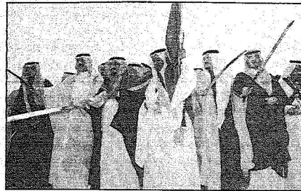
سموه يشارك في العرصة السعودية بأمر رقية