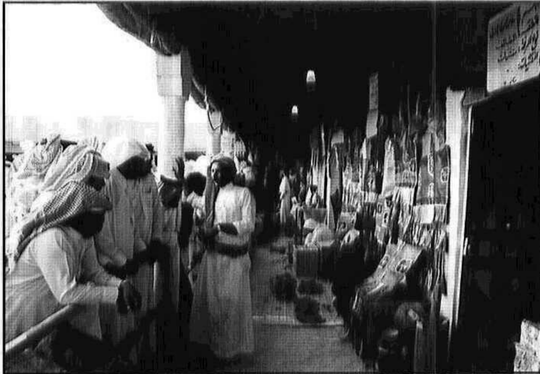
الصناعات اليدوية تشهد إقبالاً كبيراً من الزوار

الأنشطة يدور رحاها وتنظم عقودها على أرض الجنادرية، حيث جاء التوجيه السامي الكريم بأن تكون أرض الجنادرية قرية للتراث العربي السعودي تجتمع فيها مناطق بلادنا الثلاث عشرة الغالية - تبني بيوتاً لها على أرض الجنادرية تكون ناطقاً بتراثها وموروثاتها السابقة وما هو موجود الآن لتبقى سلاسل الاتصال وحلقاته ما بين الماضي والحاضر والمستقبل.