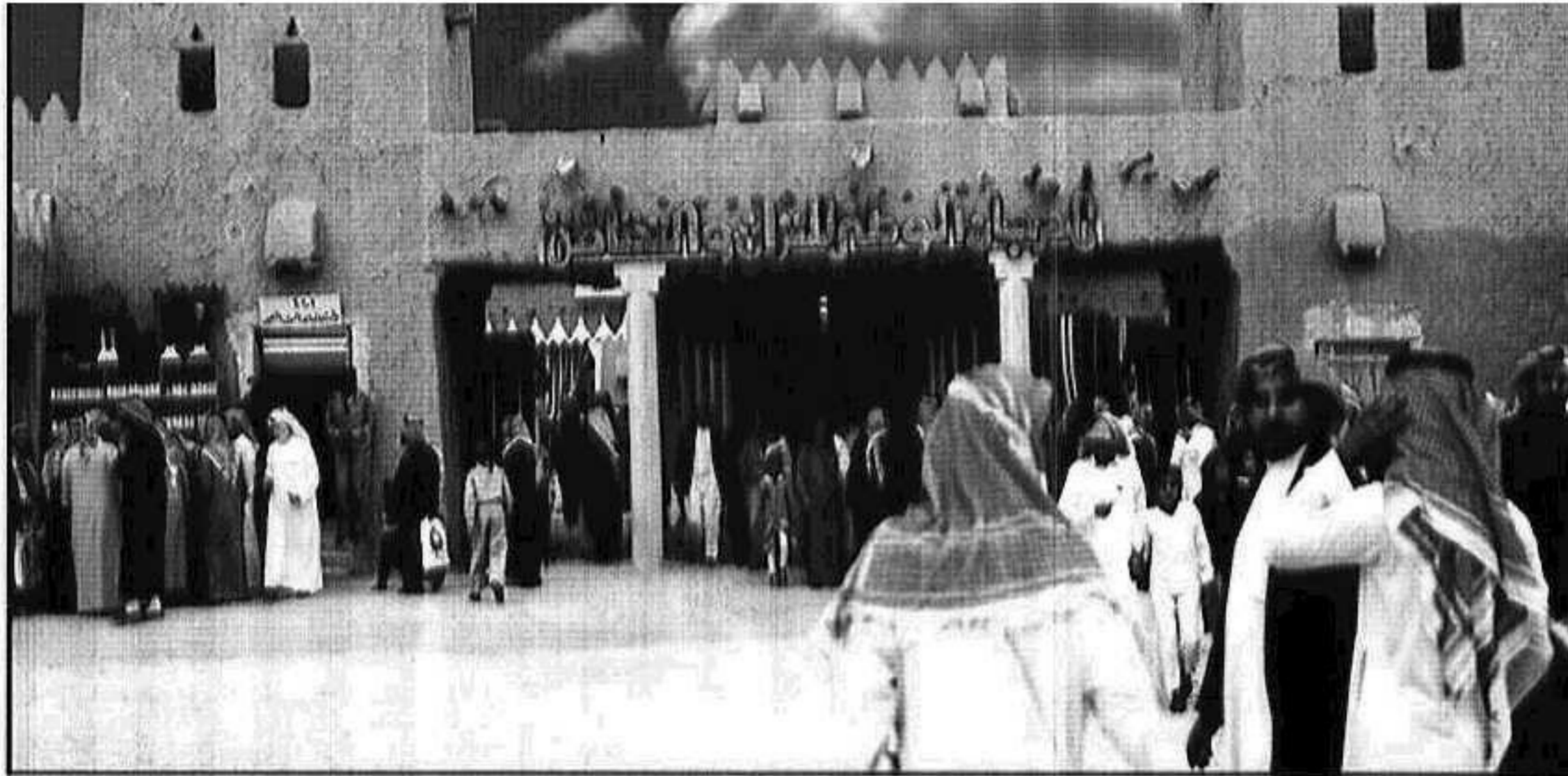
الجنادرية وجه للأصالة والتراث

استلهام التراث ومحاولات الوقوف على إيجابياته من ضروريات الحياة المعاصرة؛ وذلك لتأتي خيوط الاتصال معقودة ما بين الماضي والحاضر وتندفع معاني الأصالة والمعاصرة، لتبني قاعدة أمينة للانطلاق بالحاضر إلى المستقبل بإذن الله. ولهذا نرى الأهم والشعوب تتسابق بينها لإحياء تراثها ودراسة أخباره ومناقشة أحواله لتستضيء به في مسيرة أجيالها وحياتها. وهل هناك من شعب أو أمة يزخر تراثها وحضارتها بما ازدهرت به حضارتنا العربية على عدة قرون من تاريخ العالم البشري؟.