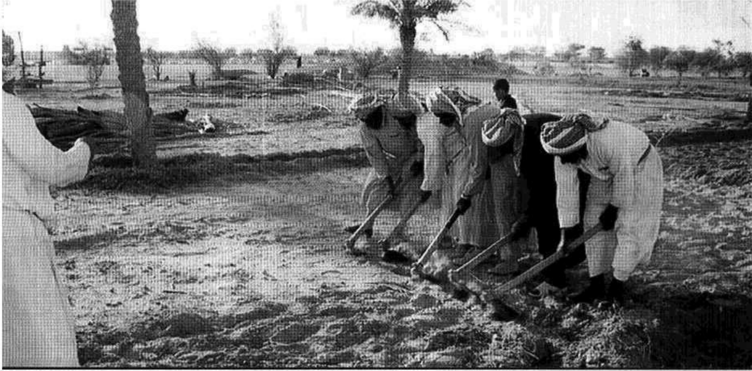
استعدادات الماضي تبعث التفاؤل بالحاضر