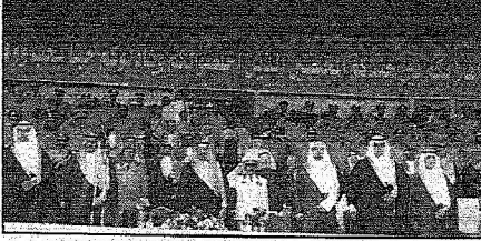
الأمير عبدالرحمن يؤدي للتحية أثناء عرس السلام الملكي

والطيران والمفتش العام بمنطقة عسير نساء أمس بعد أن نقل جنيات وتهيأ خادم الحرمين الشريفين وسمو ولي عده الأمين - رعاهما الله - لمنسوبي القوات المسلحة بالمنطقة الجنوبية بمناسبة عيد الفطر المبارك .