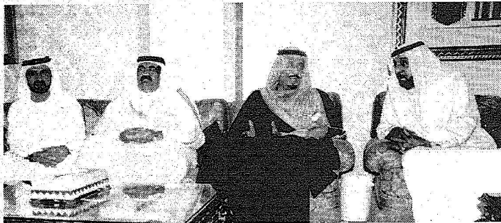
الامير سلمان بن عبد العزيز يقدم تمأزبه الى رئيس الإمارات ونائبه. (وام)

كُرست دولة الإمارات، الرجل القوي في دبي وحاكمها، الشيخ محمد بن راشد آل مكتوم في المركز الثاني على الصعيد الاقتصادي بانتخابه نائباً لرئيس الدولة وتكليفه بتشكيل حكومة جديدة، وذلك بعد ساعة واحدة على وداع شقيقه الأكبر الشيخ مكتوم بن راشد آل مكتوم إلى مثواه الأخير ظهر أمس في جنازة تقدمها الشيخ خليفة بن زايد رئيس الدولة وحكام الإمارات أعضاء المجلس الأعلى وأعيان البلاد وعدد من قادة وزعماء الدول العربية والإسلامية. وبعد يوم على تسلمه مقاليد الحكم في إمارة دبي اختار المجلس الأعلى للاتحاد، في اجتماع عقده في قصر زعبيل في دبي برئاسة الشيخ خليفة بن زايد ومشاركة أعضاء المجلس الأعلى