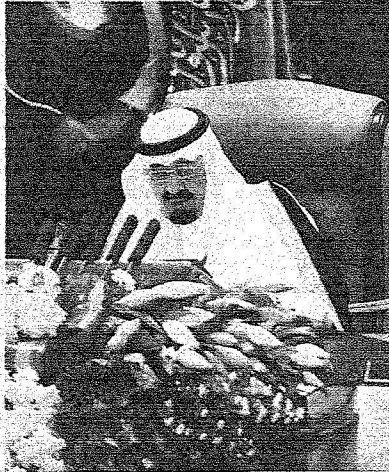
.. ويلقي كلمته