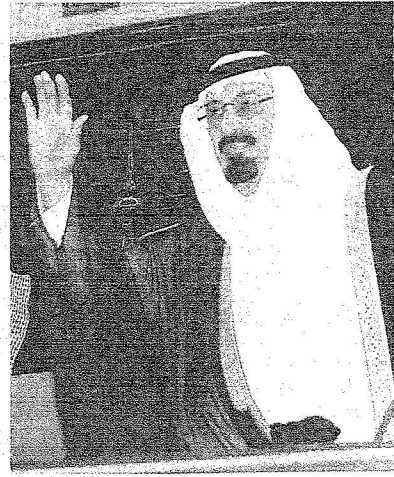
الملك عبدالله يحمي أعضاء الشورى لحظة وصوله