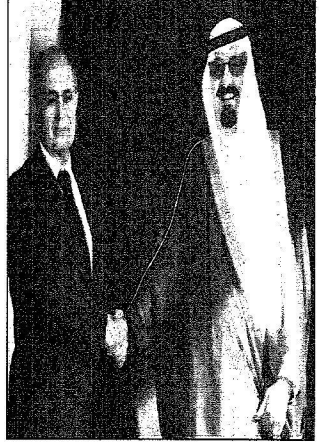
الملك عبدالله مع أعضاء الرئيس ميرزوف على مدخل القصر الرئاسي (أبو)