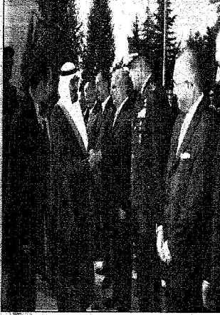
الملك عبدالله مع أعضاء فريق المنتخبين (أبو حيا)