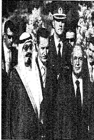
الملك عبدالله الثاني مع الرئيس سيرج لالاجوفا أثناء زيارته إلى البرلمان التركي (أيساراً)