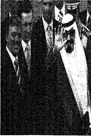
الملك عبدالله الثاني وصوله إلى الأردن في استقباله وزير الخارجية التركي عبدالله غول (يساراً)