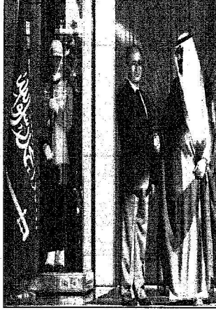
الملك عبدالله والوزير سبزان في القصر الرئاسي (أبو)