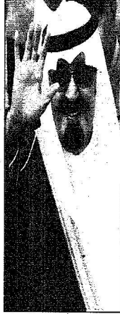
الملك عبد الله يحيى مستشهيد في مطار أنقرة (القدس)