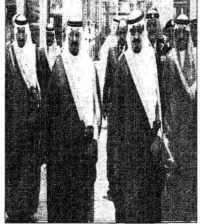
مطار خادم الحرمين الشريفين جدة وأب

الإعلام التركي: زيارة الملك عبدالله حدث لا يتكرر كثيراً في تركيا