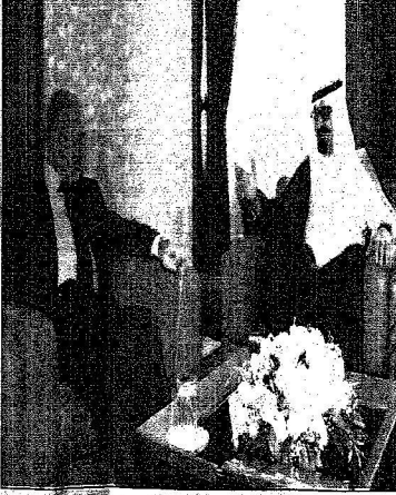
الملك عبد الله خلال استقباله مع الرئيس التركي (بيشوا)