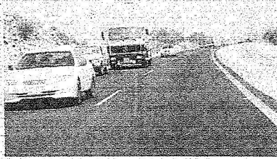
شبكة طرق عملاقة